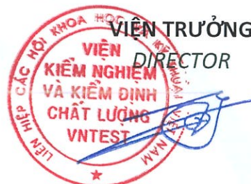
Ths. TRỊNH CÔNG SƠN